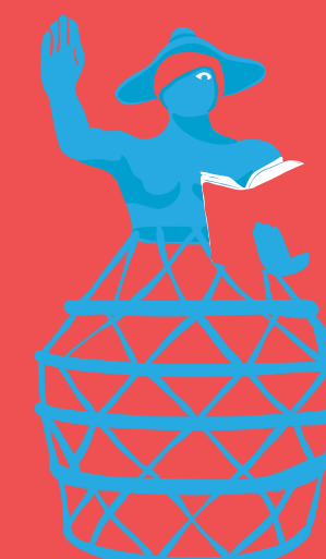
CABRA CEGA SÍLVIO CRÓ