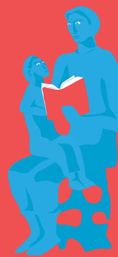
MATERNIDADE AMÂNDIO DE SOUSA