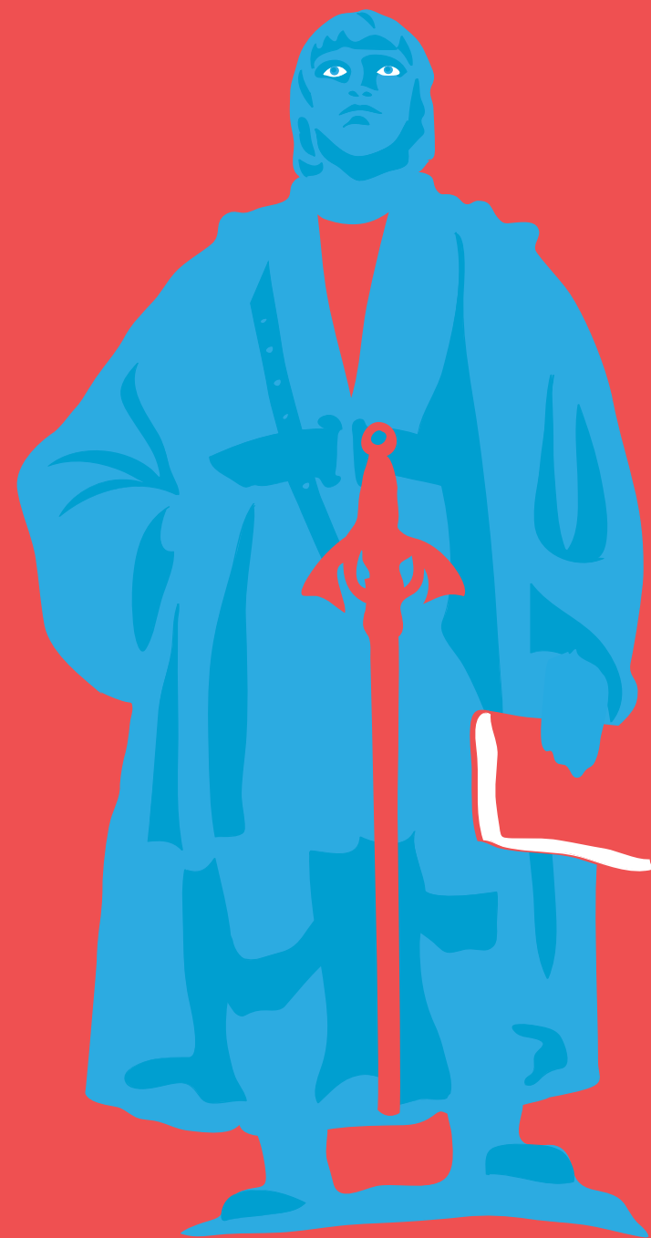
JOÃO GONÇALVES ZARCO FRANCISCO FRANCO