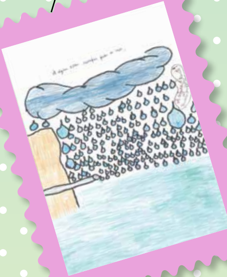
Tomás Passos, 3º ano