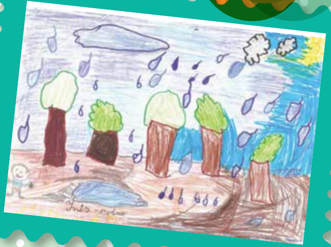
Inês, 1º ano