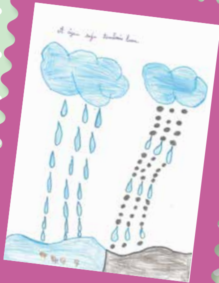
Lara, 3º ano