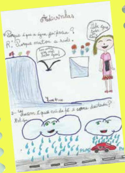
Eva, 4º ano