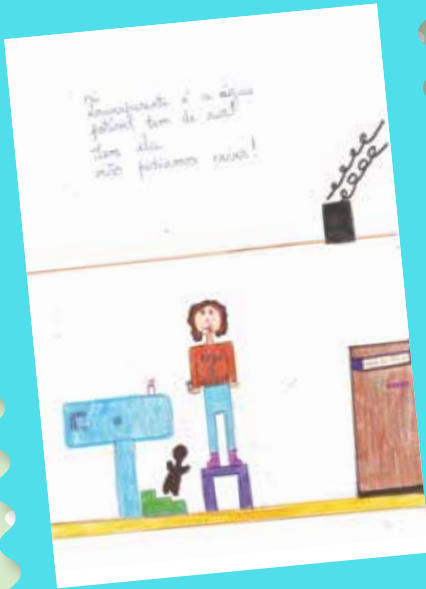
Inês Abreu, 3º ano