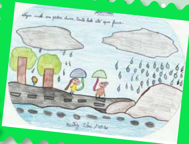
Beatriz, 4º ano