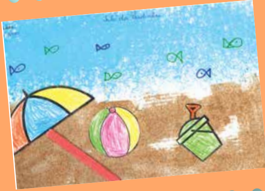
Luísa, 4 anos, sala dos Pandinhas