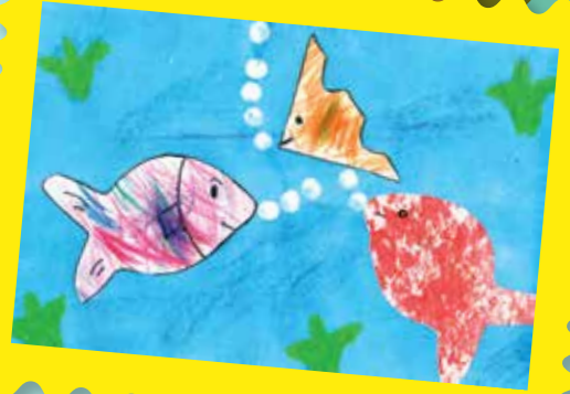
Manuel, 3 anos, sala dos Abelhinhas