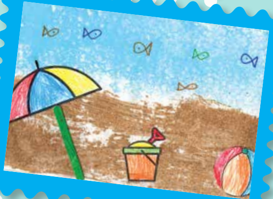
Martim, 5 anos, sala dos Pandinhas