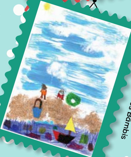
Luis Rafael, sala dos Bâmbis