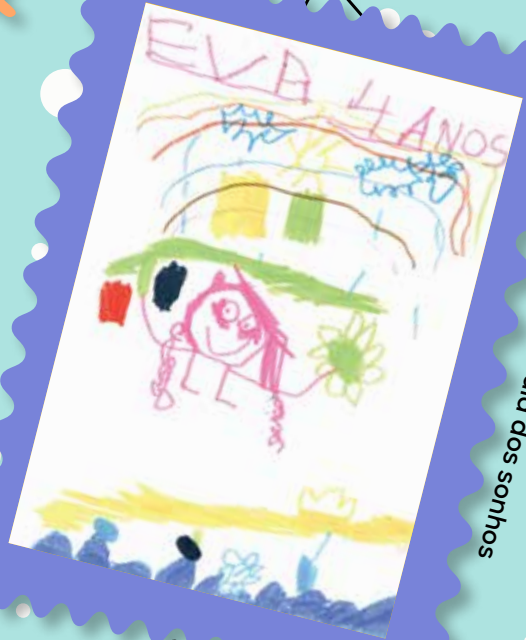
Eva, 4 anos, sala dos sonhos