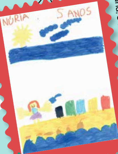
Núria, 5 anos, sala dos Sonhos