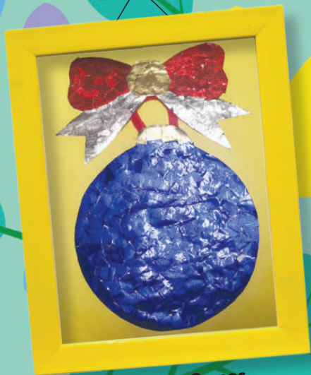
Rodrigo Leça, 6 anos