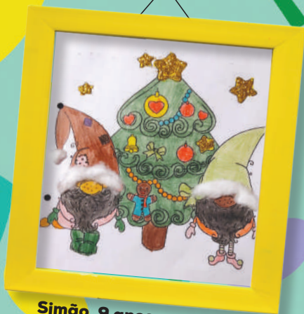
Simão, 9 anos