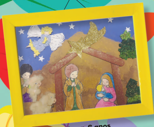
Rodrigo Leça, 6 anos