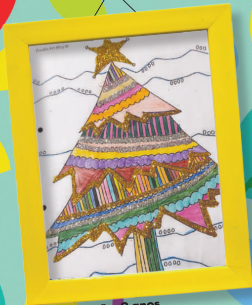
Simão, 9 anos